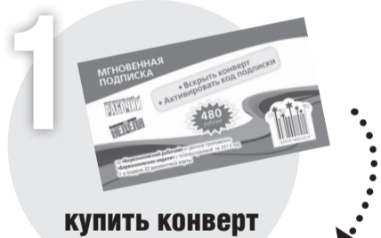
1 купить конверт

И все. Подписку вы оформили. Кстати, редакция перечислит в фонд «Никольский» по 10 рублей с каждой подписки на комплект «Березниковский рабочий» + «Березниковская неделя»-2013. Эти деньги пойдут на строительство Никольского храма.